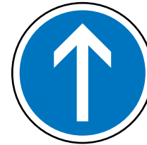
Obligation d'aller tout droit

A chacun de créer ses propres outils (possibilité d'imprimer et de plastifier tout type d'image, de panneaux, etc...). La manipulation de fiches panneaux, le jeu des 5 familles de panneaux, peuvent être également des exercices pour faciliter la mémorisation et la compréhension.